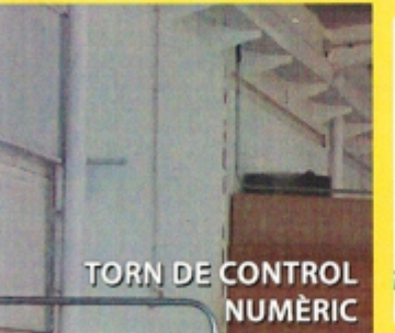
TORN DE CONTROL NUMÈRIC